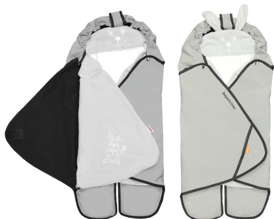
Zavinovačka SALMA s vloženou zavinovačkou S KAPUCÍ

Spojením vznikne zavinovačka s výhodami vnějšího funkčního materiálu softshell a lepším zateplením vnitřní strany.