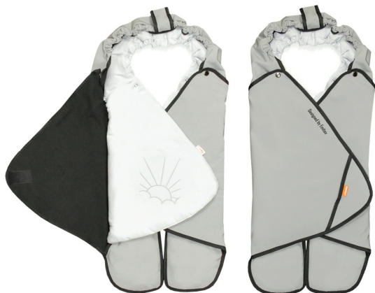
Zavinovačka SALMA s vloženou zavinovačkou BARA