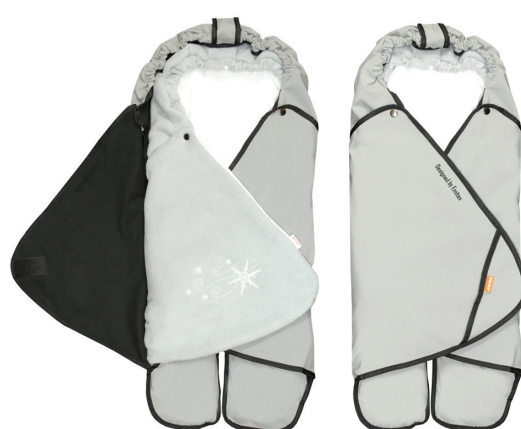
Zavinovačka SALMA s vloženou zavinovačkou ZOE