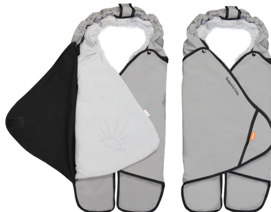
Zavinovačka SALMA s vloženou zavinovačkou MAJA

Zavinovačka SALMA se může také použít jako druhá vnější vrstva , kdy se dovnitř vloží další zavinovačka do autosedačky.